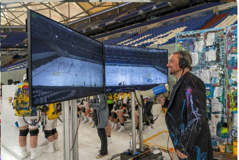
Pressekontakt: TAS Emotional Marketing GmbH / Anna Dono